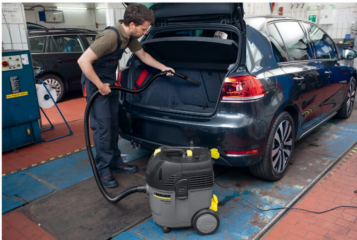
NT 35/1 Ap