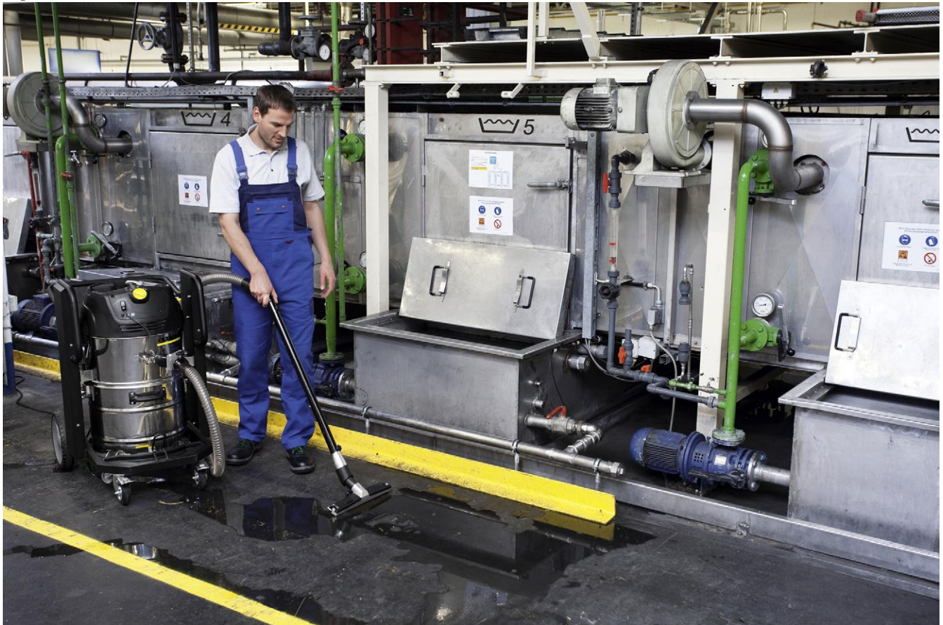
IVC 60/30 Ap