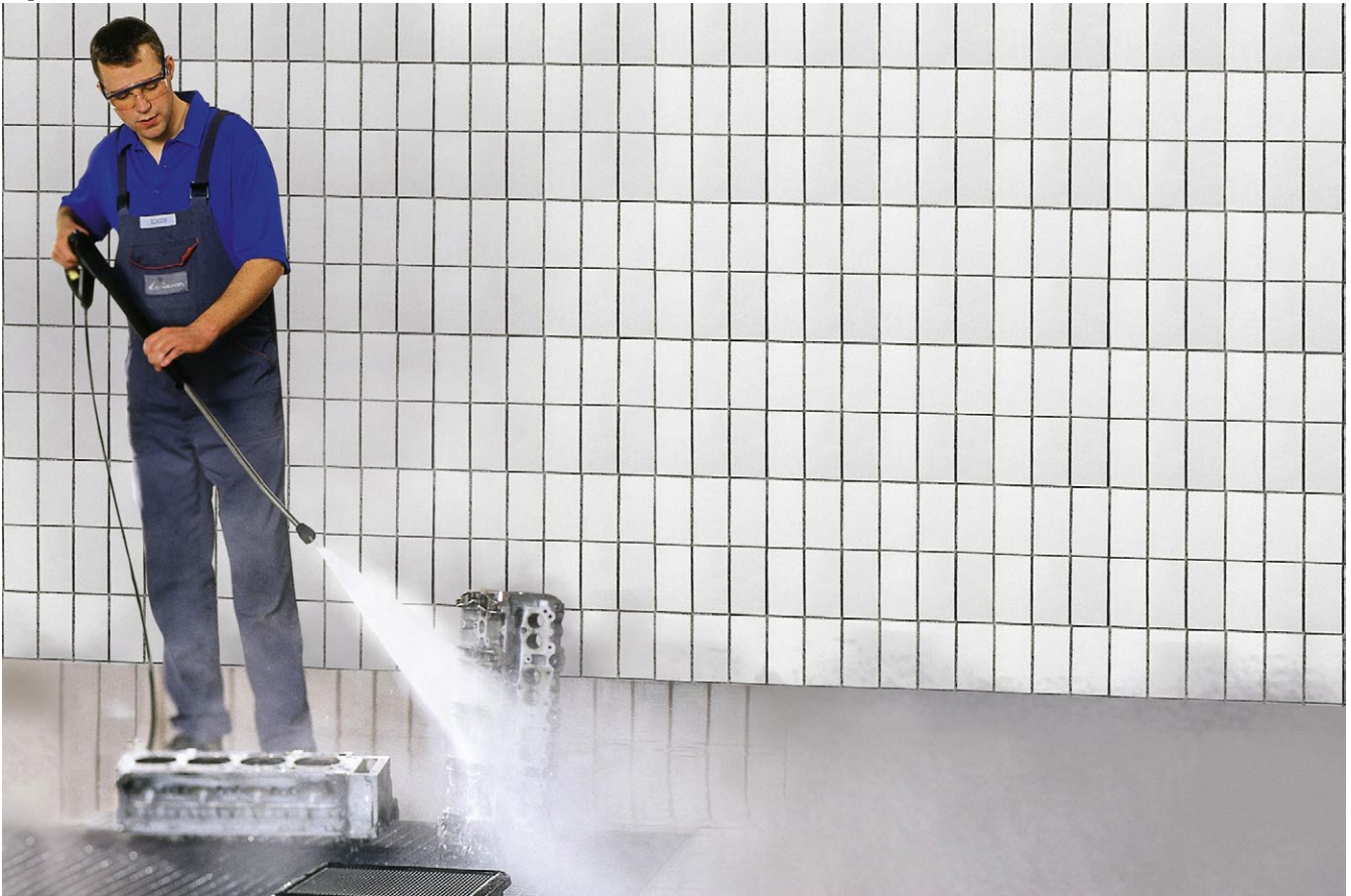
HD 801 B Cage