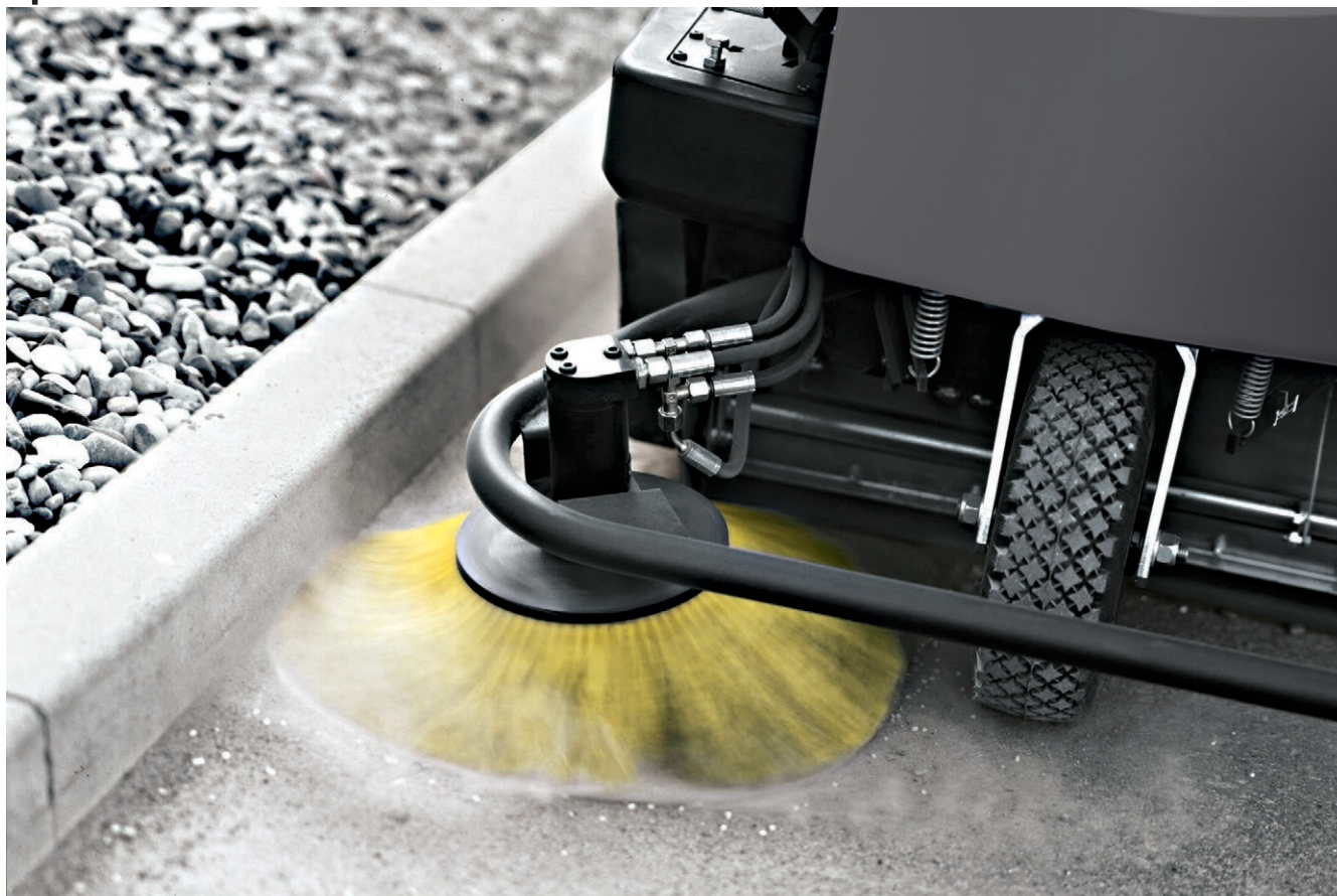
KM 100/100 R Lpg

■ Система автоматической очистки фильтра