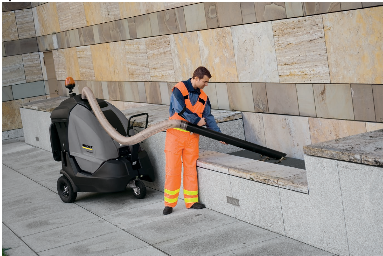
IC 15/240 W Adv