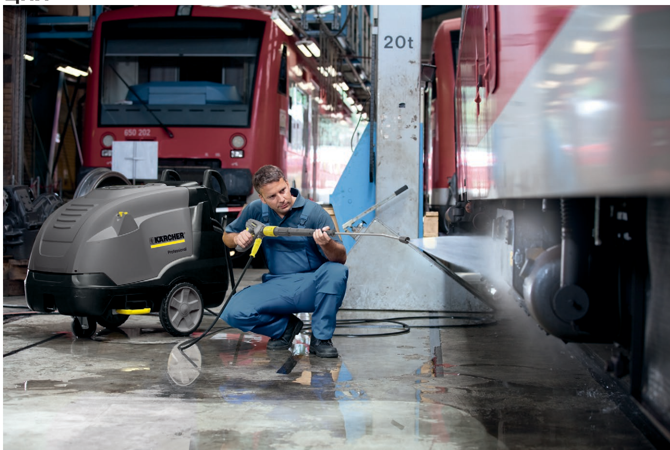
HDS-E 8/16-4 M 24KW