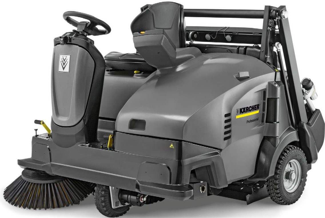
KM 125/130 R D