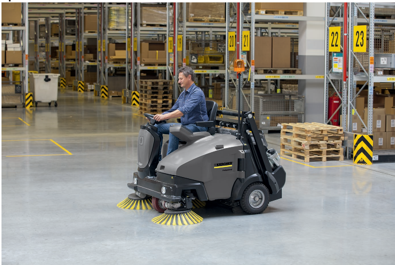
KM 125/130 R D