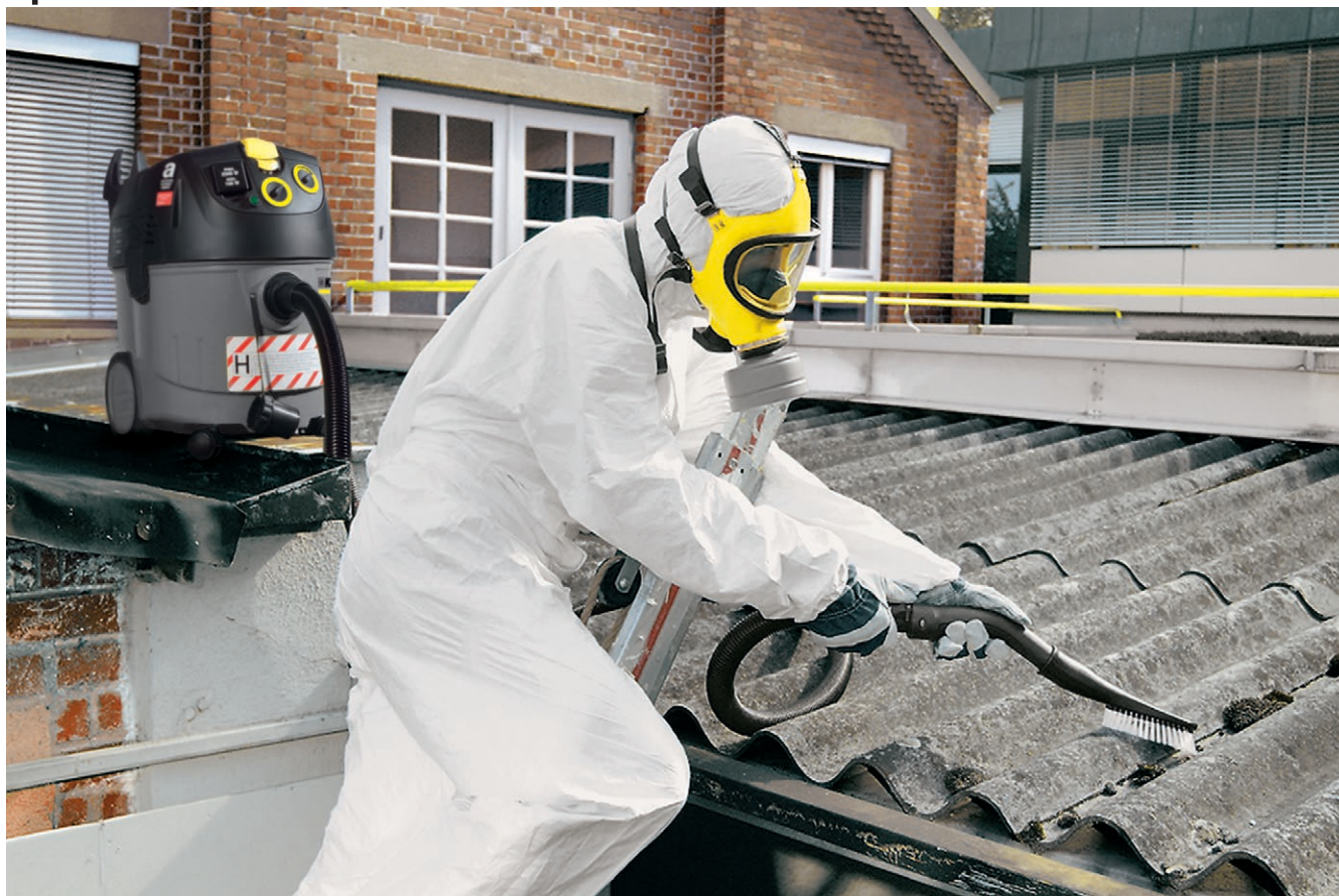
NT 35/1 Tact Te H *EU