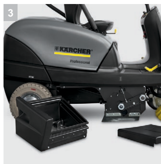
3 Простота обслуживания