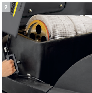
2 Фильтр большой площади с устройством автоматической очистки.