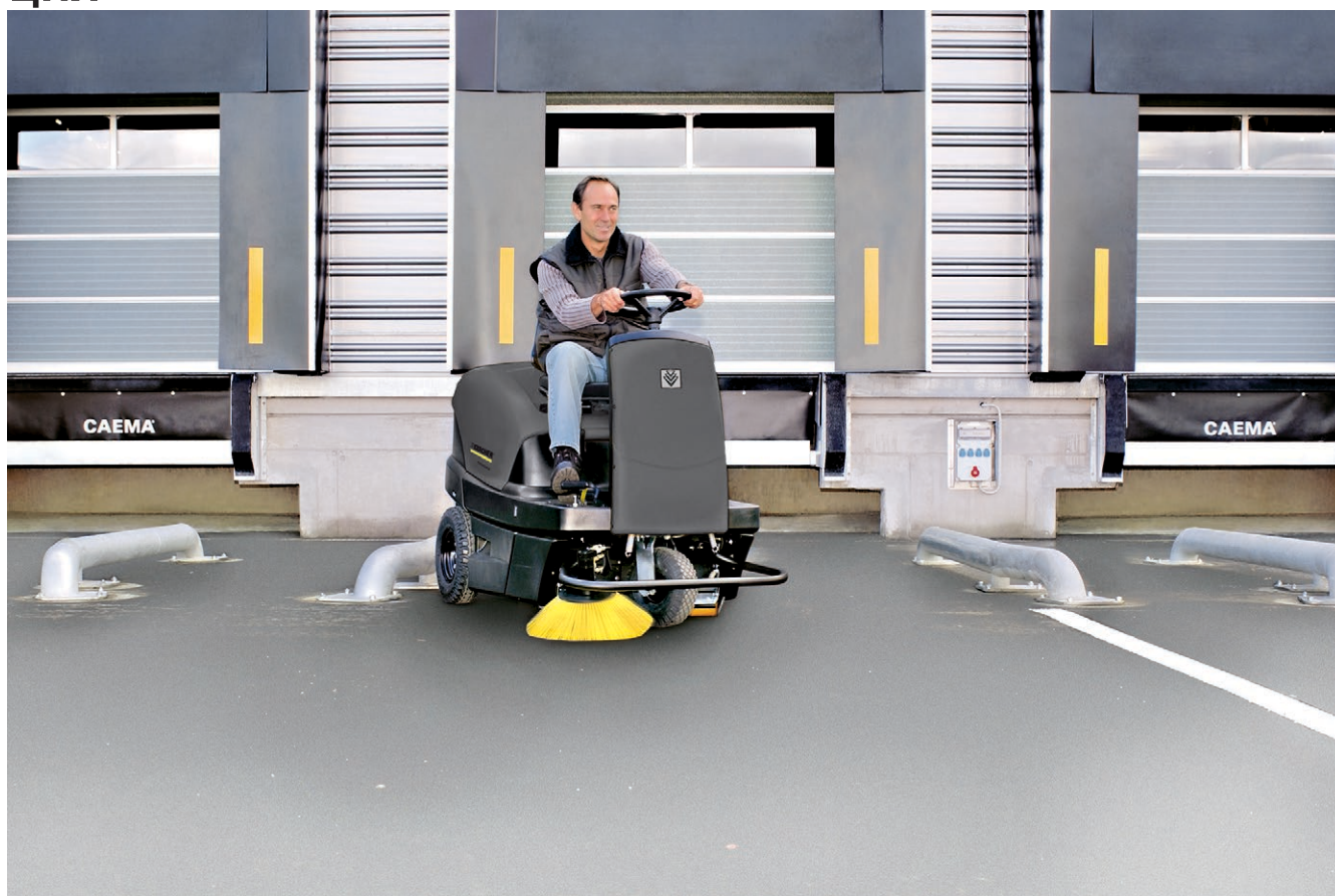
KM 100/100 R Vp

■ Система автоматической очистки фильтра