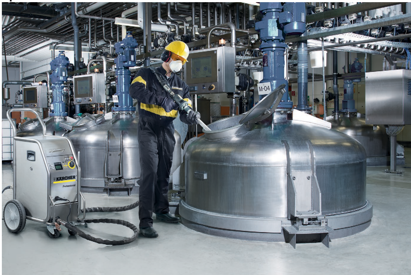
IB 7/40 Classic