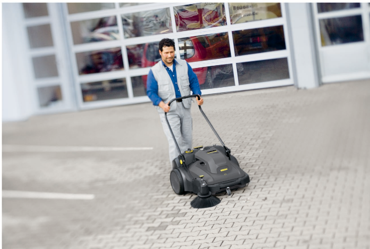
KM 70/30 C Bp Pack Adv

■ Электропривод цилиндрической и боковой щеток