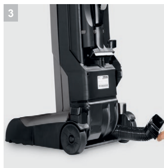
3 Превосходная чистка