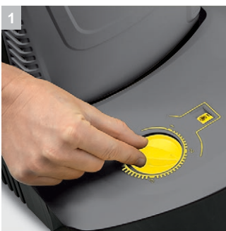
1 Индикаторная лампа

Щеточный пылесос сочетает превосходную эффективность очистки с высокой эргономичностью (благодаря держателям для принадлежностей и кабеля, удобству управления и регулируемой по высоте рукоятке) и привлекательной ценой.