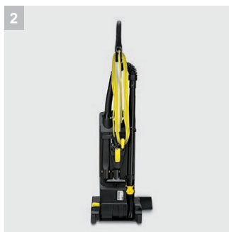
2 Кабель Highflex