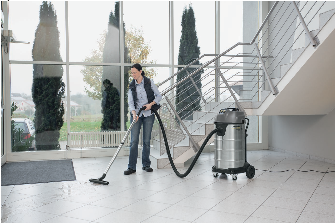
NT 90/2 Me Classic Edition *EU