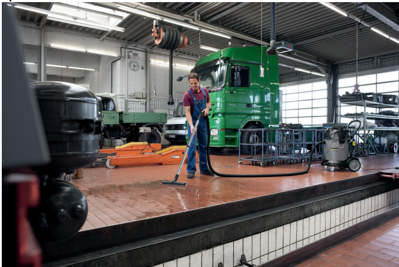
NT 70/2 Tc